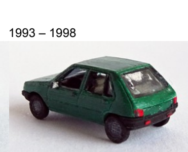
1993 – 1998