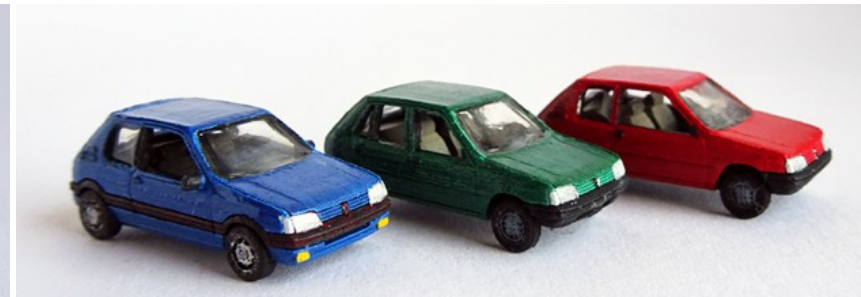
1990 – 1998