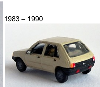
1983 – 1990