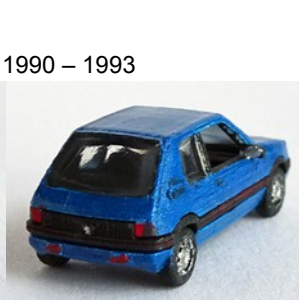
1990 – 1993