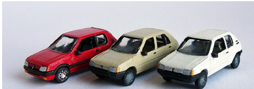
1983 – 1990