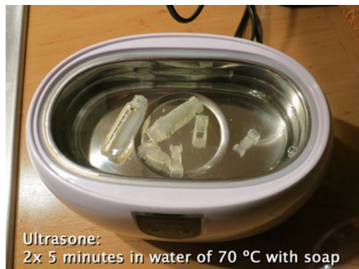
Ultrasonie: 2x 5 minutes in water of 70 °C with soap