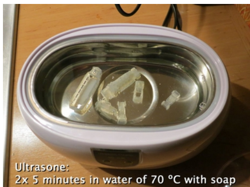
Ultrasone: 2x 5 minutes in water of 70 °C with soap