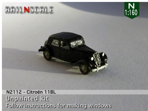
N2112 - Citroën 11BL