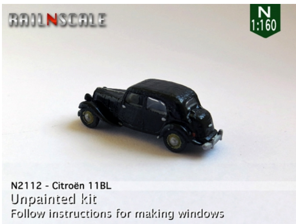
N2112 - Citroën 11BL